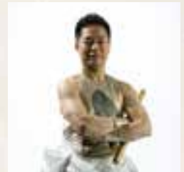
林 英哲